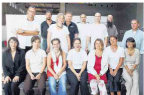
Sie stellen in der Brauerei aus.