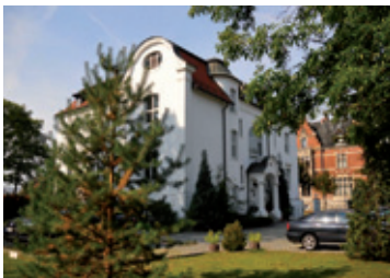
Die historische Villa in der Wasserstadt in Dessau ist seit rund einem Jahr Sitz der Agentur „Die Stilartisten“.

Die Stilartisten – Atelier für Kommunikation & Design Enke, Held, Prill GbR Wasserstadt 1 06844 Dessau-Roßlau Tel. 0340.2549317 www.die-stilartisten.de